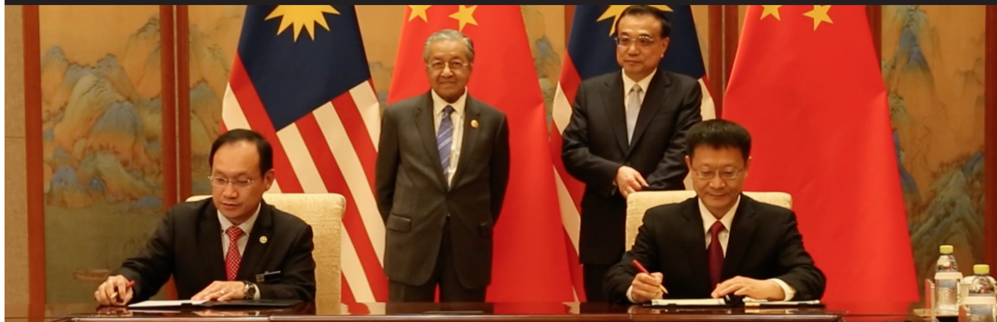
Majlis menandatangani memorandum persefahaman antara MPOC dan CFNA yang disaksikan Dr Mahathir dan Li Keqiang di Beijing.