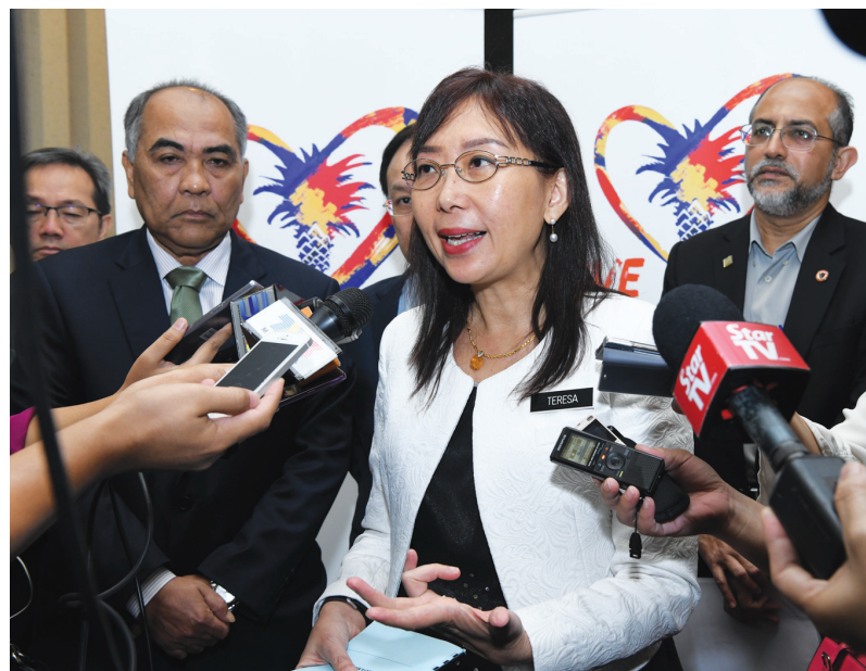
Menteri Industri Utama, Teresa Kok ketika ditemubual pemberita sempena Seminar Pemakanan anjuran Lembaga Minyak Sawit Malaysia (MPOB) di Putrajaya.