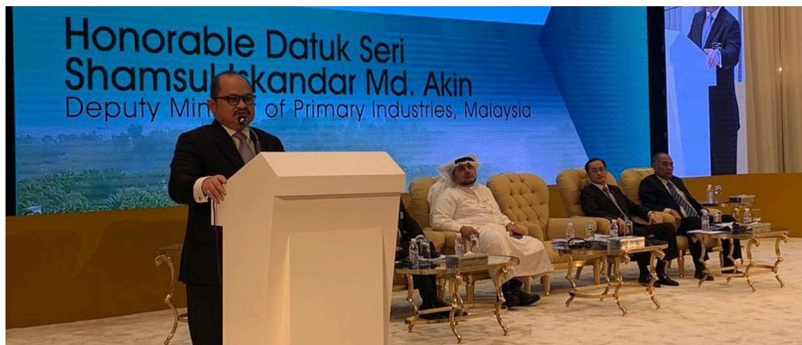
Datuk Seri Shamsul Iskandar berucap di POTS Saudi 2019.

Katanya, pelaburan di Arab Saudi menjanjikan pasaran besar. Minyak sawit dalam pek pengguna boleh dipasarkan di negara Afrika Barat dan juga negara lain di Afrika