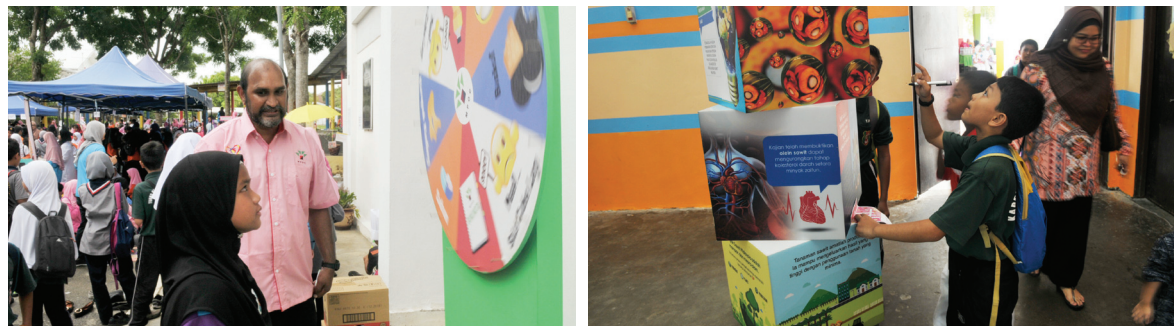
Aktiviti sampingan dijalankan seperti teka silang kata dan pusingan roda sawit.