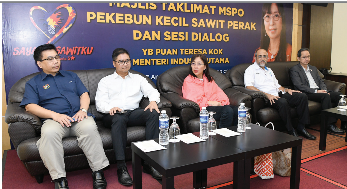
Teresa menghadiri taklimat kepada pekebun kecil di Teluk Intan.

Dalam ucapannya pada program Taklimat MSPO dan sesi dialog bersama pekebun kecil di Sitiawan dan Teluk Intan, beliau