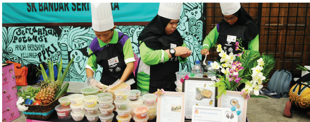
Pasukan dari SK Seri Makmur sedang menyediakan masakan yang dipertandingkan.