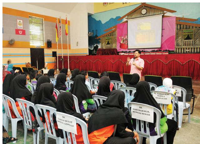
Pegawai MPOC memberi taklimat mengenai minyak sawit dan pemakanan sihat kepada penyokong dari sekolah yang mengambil bahagian.