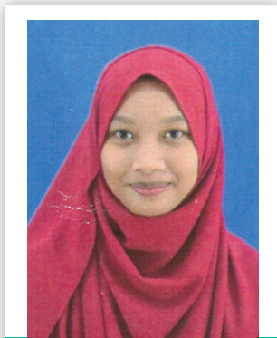
PEMENANG PERTAMA KATEGORI 1 - PELAJAR SEKOLAH MENENGAH

Pengamal terbukti akan menyekat paras kolesterol dalam darah. Kajian dijalankan mendapati, mi-