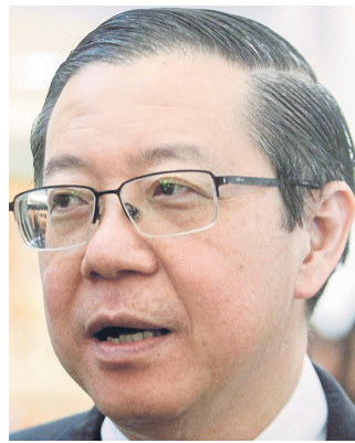
Lim Guan Eng

Selain pinjaman mudah, kerajaan juga menambah jumlah peruntukan bagi tujuan pelaksanaan pensijilan Minyak Sawit Mampun Malaysia (MSPO) sebanyak RM100 juta bagi menggalakkan lebih ramai pengusaha sawit memperoleh sijil masing-masing menje-