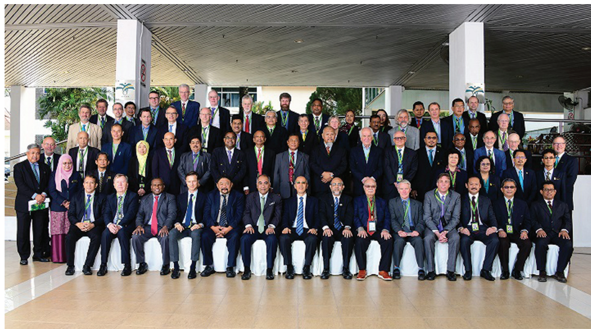
Ahli Penasihat Program (PAC) MPOB yang menghadiri mesyuarat tahunan selama seminggu bagi memantau dan mengulas cadangan projek penyelidikan baharu di Ibu Pejabat MPOB, Bangi.