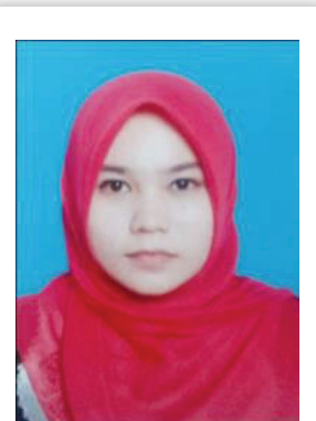
PEMENANG PERTAMA KATEGORI 2 - AWAM

Kementerian Industri Utama menyasarkan peningkatan sebanyak 10 peratus dalam penggunaan domestik bagi produk