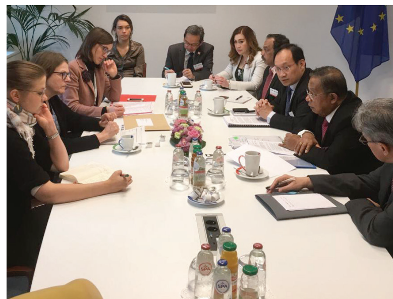
Mesyuarat di antara CPOPC dengan Naib Presiden Parlimen Eropah, Heidi Hautala di Brussels.

Suruhanjaya Eropah menekankan, perintah ini bertujuan mengurangkan pelepasan gas rumah