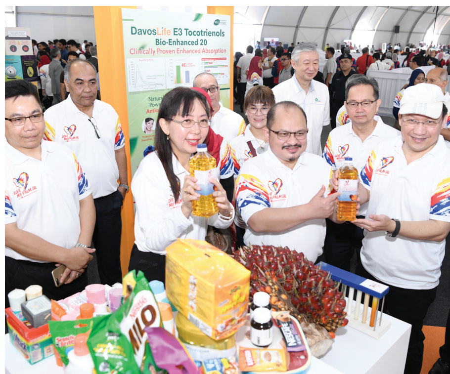
Teresa Kok dan Datuk Seri Shamsul Iskandar Mohd Akin melawat pameran produk sawit sempena pelancaran kempen Sayangi Sawitku.