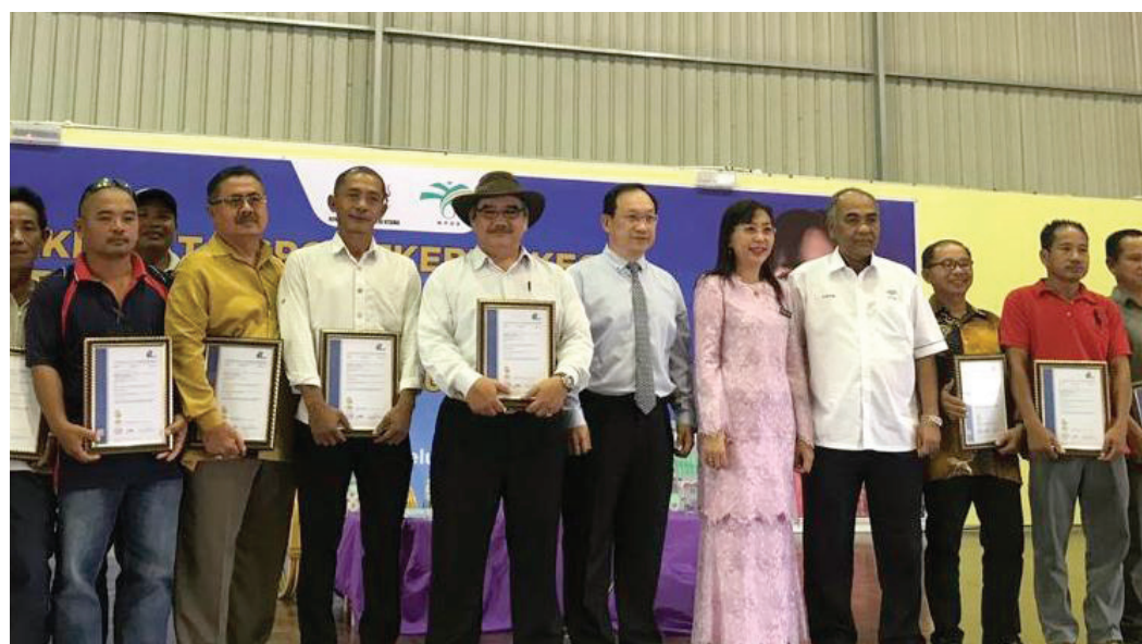
Menteri Industri Utama Teresa Kok bersama pekebun kecil yang menerima sijil Minyak Sawit Mampan Malaysia (MSPO) di Kota Belud, Sabah.