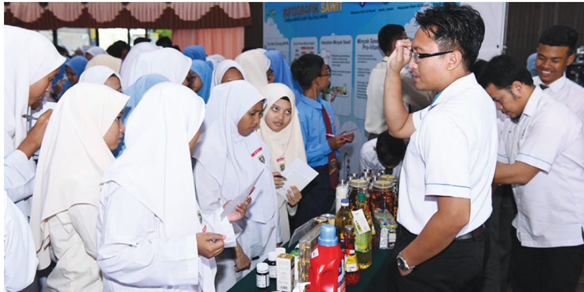
Pelajar SMK KOMSTAR mendengar penerangan mengenai produk berasaskan sawit yang dipamerkan sempena program Negaraku Sawitku di Terengganu.

Selain ceramah dan sesi interaktif, MPOB turut mempamerkan poster serta produk sawit berupa makanan dan bukan makanan sebagai pendedahan kepada warga