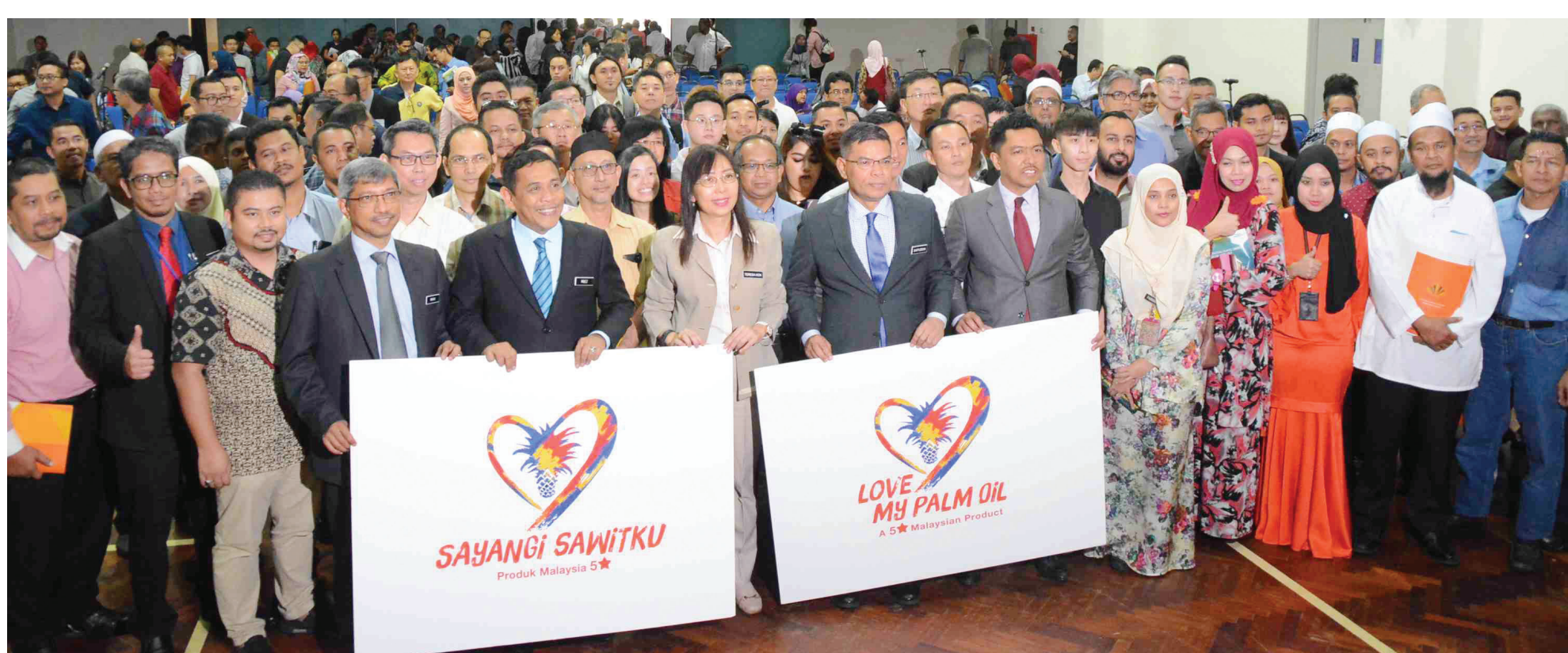
Menteri Industri Utama, Teresa Kok dan Menteri Perdagangan Dalam Negeri dan Hal Ehwal Pengguna, Datuk Saifuddin Nasution Ismail bersama syarikat di bawah Skim Penstabilan Minyak Masak (COSS) yang diadakan di Ibu Pejabat Lembaga Minyak Sawit Malaysia (MPOB) di Bangi.