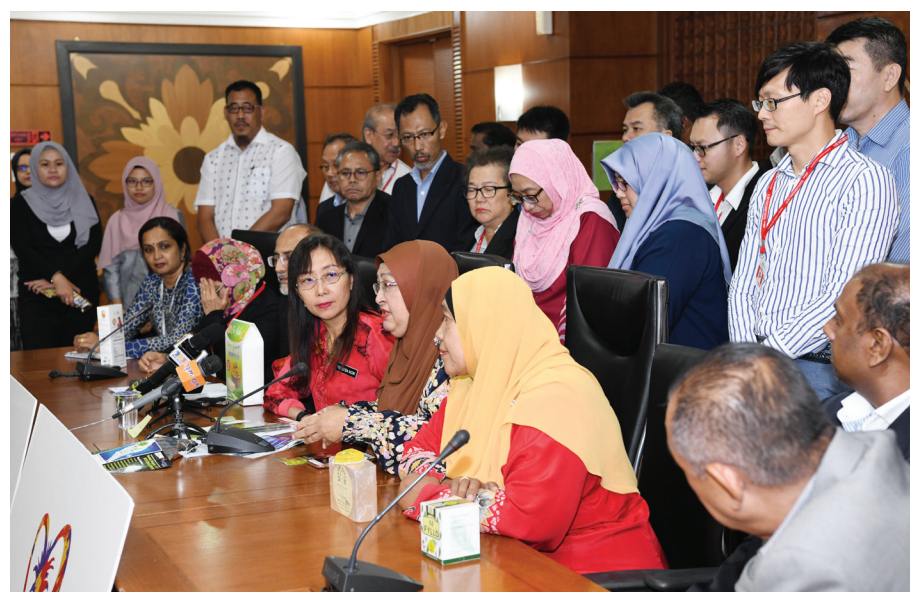
Sebahagian pengusaha dan pengeluar produk berasaskan sawit bersama Menteri Industri Utama, Teresa Kok pada sidang media di Putrajaya.