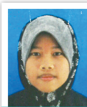
PEMENANG PERTAMA KATEGORI 1 - PELAJAR SEKOLAH MENENGAH

Kita perlu proaktif dalam mengatasi masalah ini daripada terus merebak kemudian hari. Antara langkah menangkis cabaran ini ialah mengemukakan bantahan secara komprehensif kepada