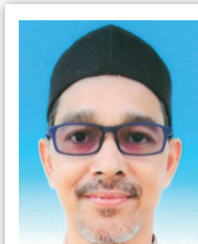
PEMENANG PERTAMA KATEGORI 2 - AWAM