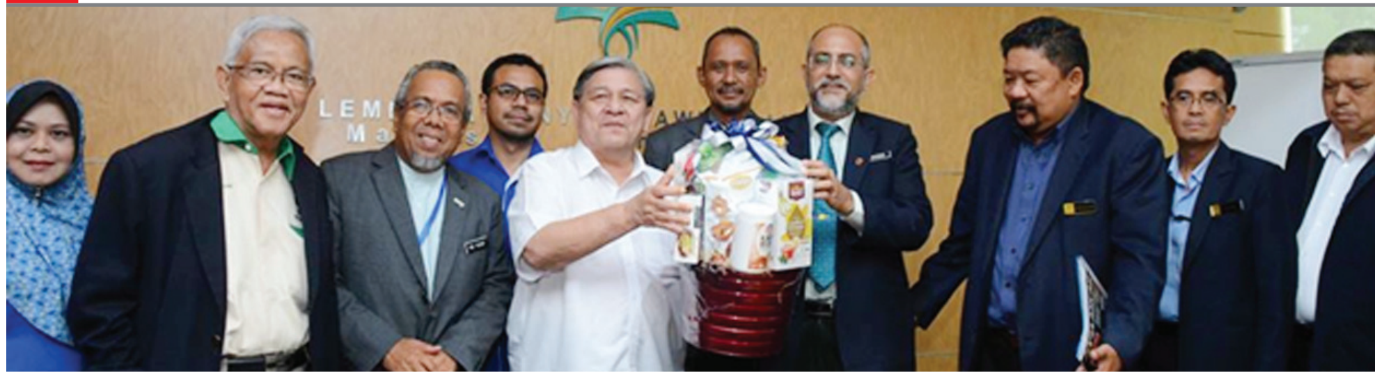
Kunjungan hormat ANGKASA ke ibu pejabat MPOB di Bangi.