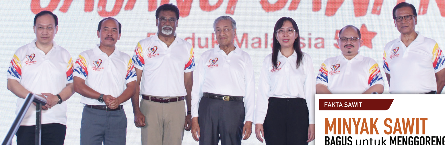
Dr Mahathir melancarkan Kempen Sayangi Sawitku di Pulau Carey.