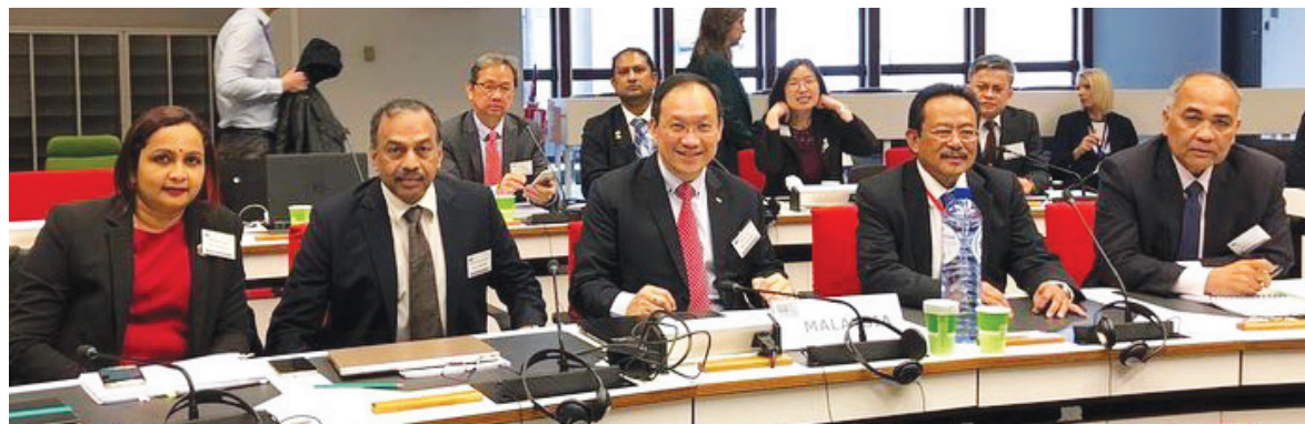
Delegasi Malaysia diketuai Dr Tan (tengah) ketika mesyuarat berkaitan risiko ILUC bio bahan api di Brussels.

Malaysia juga memaklumkan analisis menyeluruh ke atas peraturan tambahan dari aspek perundangan, teknikal dan sainti-