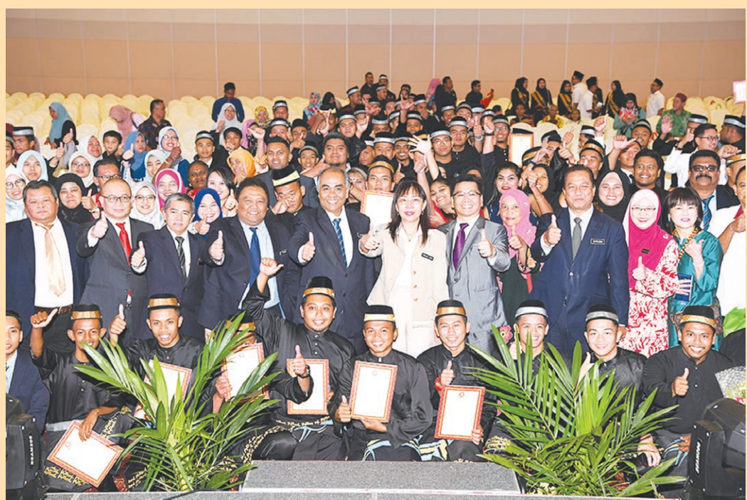
TERESA Kok bersama graduan IMPAC 2018 di Bangi.