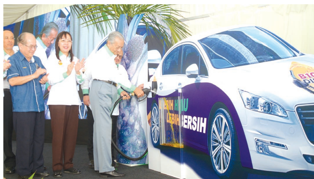
TUN Dr. Mahathir mengisi biodiesel B10 sebagai simbolik pelancaran Program B10 di sektor pengangkutan.

“Program biodiesel ini amat penting bagi negara kerana pokok sawit merupakan tanaman emas negara dan menjana ekonomi sejak sekian