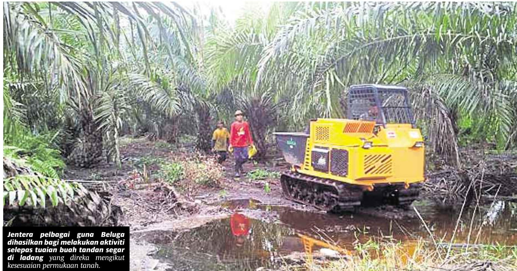
Jentera pelbagai guna Beluga dihasilkan bagi melakukan aktiviti selepas tuai buah tandan segar di ladang yang direka mengikut kesesuaian permukaan tanah.

adalah 3.13 tan untuk seorang pekerja sehari berbanding 1.5 tan untuk seorang pekerja sehari. Oleh itu, untuk pengangkutan BTS 25 tan satu hari, penggunaan Beluga hanya memerlukan 8 pekerja berbanding 16 pekerja yang menggunakan kaedah konvensional dan memberi penjimatan sehingga 50 peratus tenaga kerja.